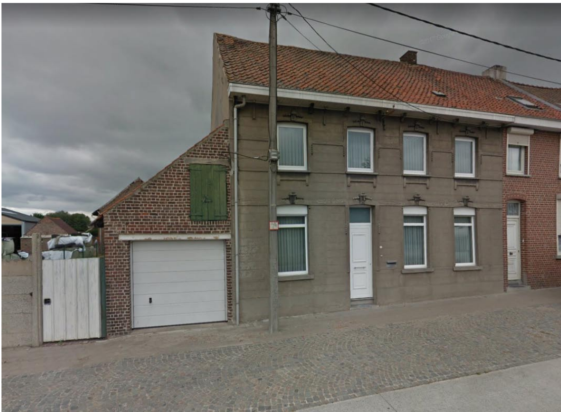
Café De Barriere anno 2017